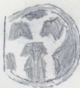
svart stämpel i nat. storlek